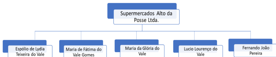
Figura 1: Estrutura Societária